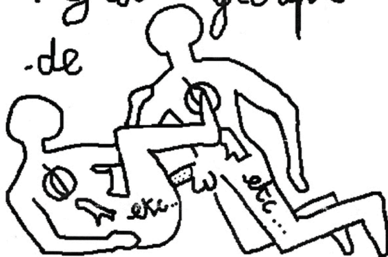
scène vue à Manhattan

les habitants de N.Y. constituent le + grd groupe de